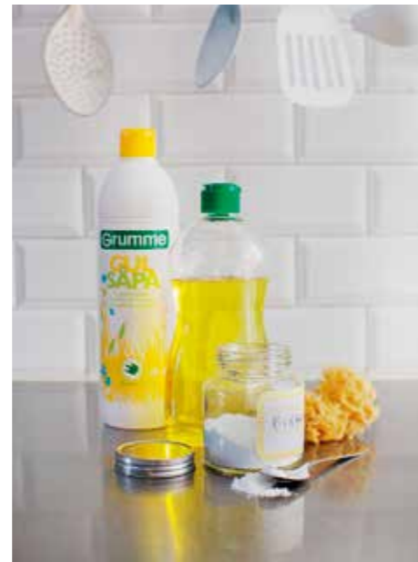
BLANDA. Effektiva rengöringsmedel fixar du själv.