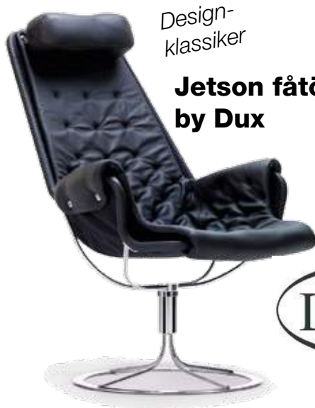
Jetson fåtölj by Dux