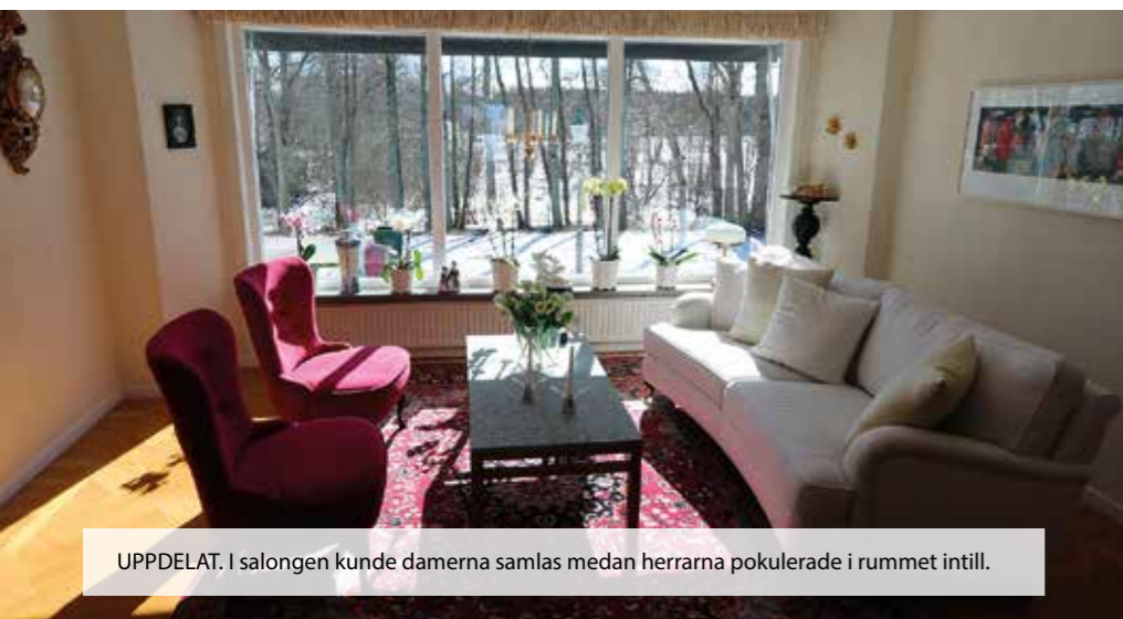
UPPDELAT. I salongen kunde damerna samlas medan herrarna pokulerade i rummet intill.