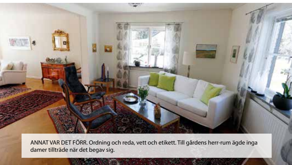
ANNAT VAR DET FÖRR. Ordning och reda, vett och etikett. Till gårdens herr-rum ägde inga damer tillträde när det begav sig.