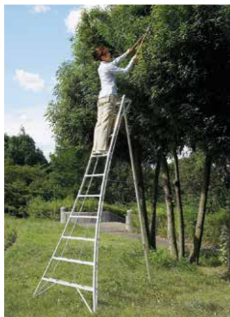
I FYRA LÄNGDER. Den stadiga stegen har tillverkats i över 50 år i Japan.