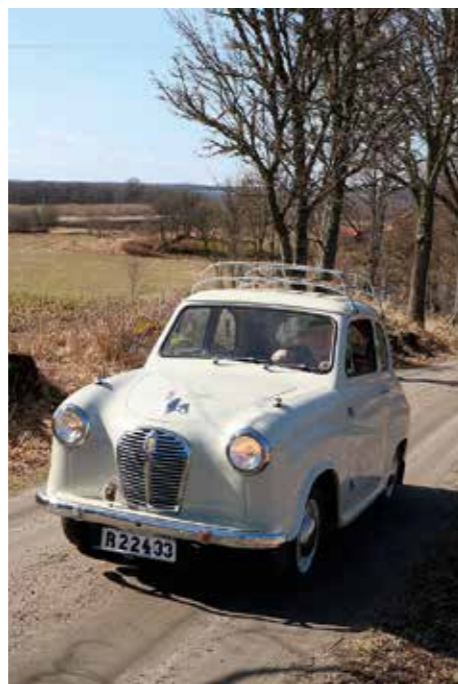
1956. Till vardags föredrar Broddetorpar'n sin lilla Austin A30 som passar in fint på traktens småvägar.

Med en hyrd lastbil skulle sedan klenoden