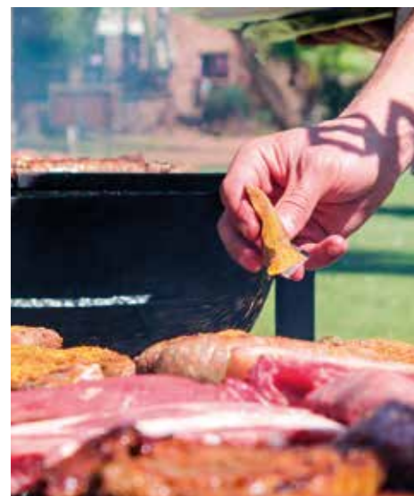
OEMOTSTÄNDLIGT. Doft, smak, textur och arom gör att vi älskar att grilla.