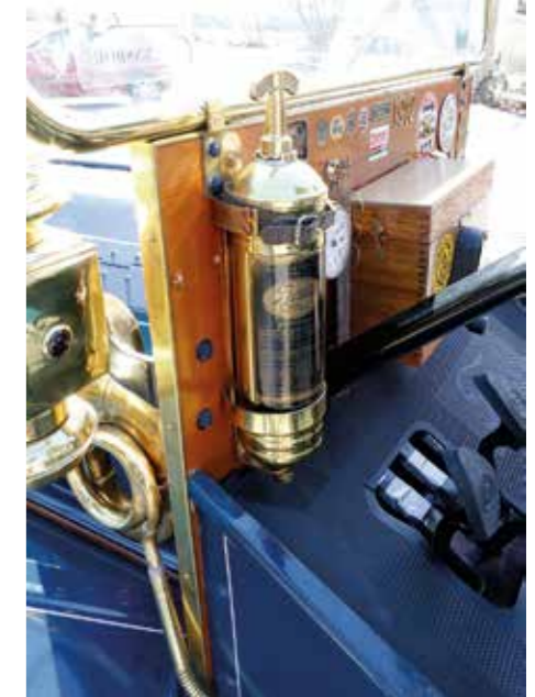
SNYGG SÄKERHET. T-Forden är utrustad med en original brandsläckare.