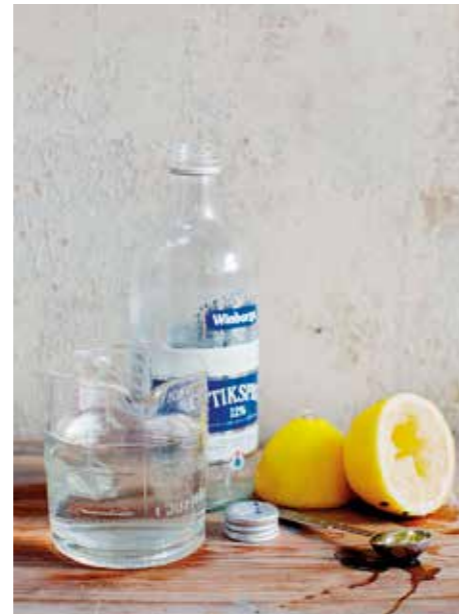
MILJÖSMART. Städa med det du redan har hemma.

CITRONER. Citroner innehåller citronsyra som är ett naturligt och mildt desinfektionsmedel.