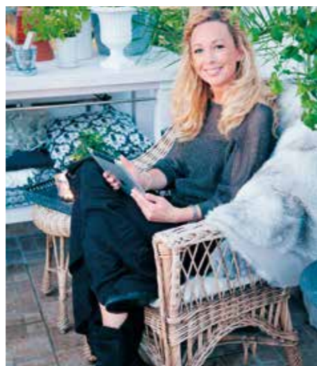
AVKOPPLING. – Jag sitter gärna en stund på kvällen i växthuset med min iPad. Googlar växter och annat till trädgården, checkar mail, surfar. Men några långa stunder av stillasittande för mig själv blir det inte. Däremot sitter jag gärna och länge tillsammans med goda vänner och ett glas vin.

– Jag har mycket energi. Sitter nästan aldrig stilla. Inte när jag är ledig heller. Blir rastlös, irriterad och otålig om jag sitter överksam. När jag fixar hemma är inte målet det viktiga, det är själva resan