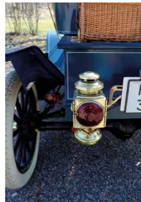
TRAFIKSÄKER. I aktern finns en röd lanterna. I fronten två med vanligt glas. Leif har fått modernisera de gamla karbidlyktorna med elektriskt ljus för att få klartecken att ge sig ut i trafiken med sin T-ford.

– Det började med att hittade ett pittoreskt torp i Halland som jag ville måla av. I det