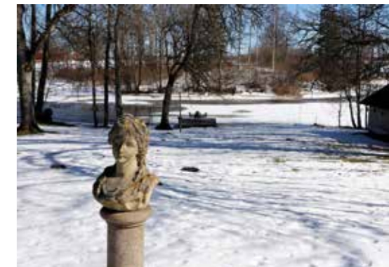
GEMENSKAP. Genom den stora tomten ringlar sig Tidans som skapat en mad nedanför huset. Sommartid samlas parets alla tio barnbarn för kräftfiske här.