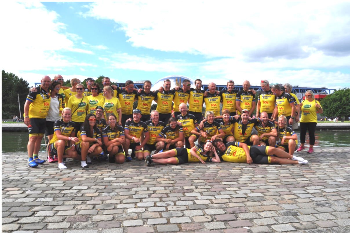
Här är 2016 års värmlandslag, första laget från Värmland i Team Rynkeby

Sommaren 2017 kommer jag vara en av ca 1700 cyklister som ska trampa ner till Paris.