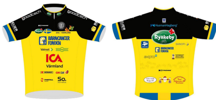
Utseendet på 2016 års cykeltröjor för Värmlandslaget

En viktig insamling är att sälja sponsorplatser på våra cykeltröjor som vi använder vid träning och cykelresan till Paris