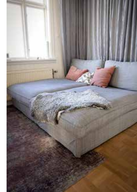
HÄNG VID SOLNEDGÅNG. I hörnet just innanför terrassen kan familjen krypa upp och mysa vid alla väderlekar.