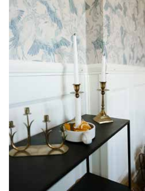
MATSALEN. I anslutning till köket har familjen sin matsal med tapeten Tranan. Ett litet sidebord pryds av ljusstakar av olika slag