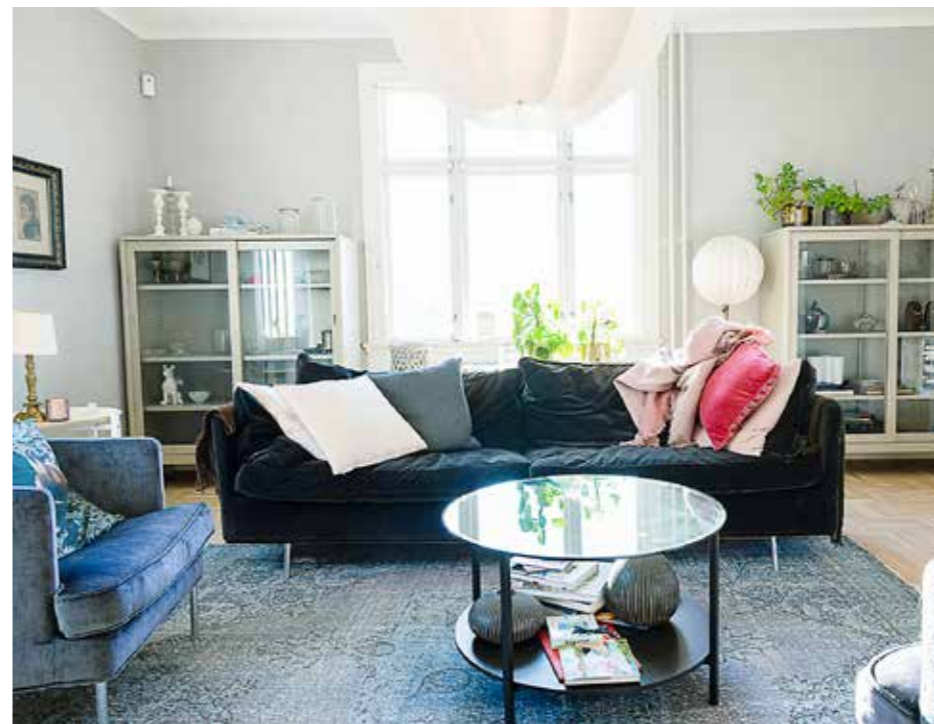
SALONGEN. Här samlas man gärna i de sköna sittgrupperna med en kopp kaffe. Solen flödar in från söder.