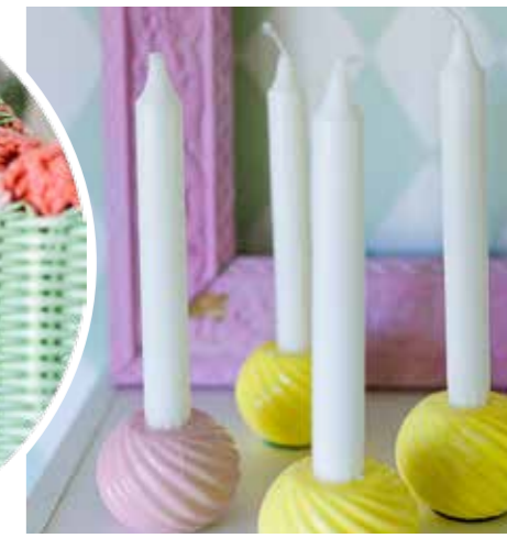
FÄRGLADA GRÄDDBAKELSER. Blickarna dras automatiskt till de gula och rosa ljusstakarna. Så härligt färgstarkt.