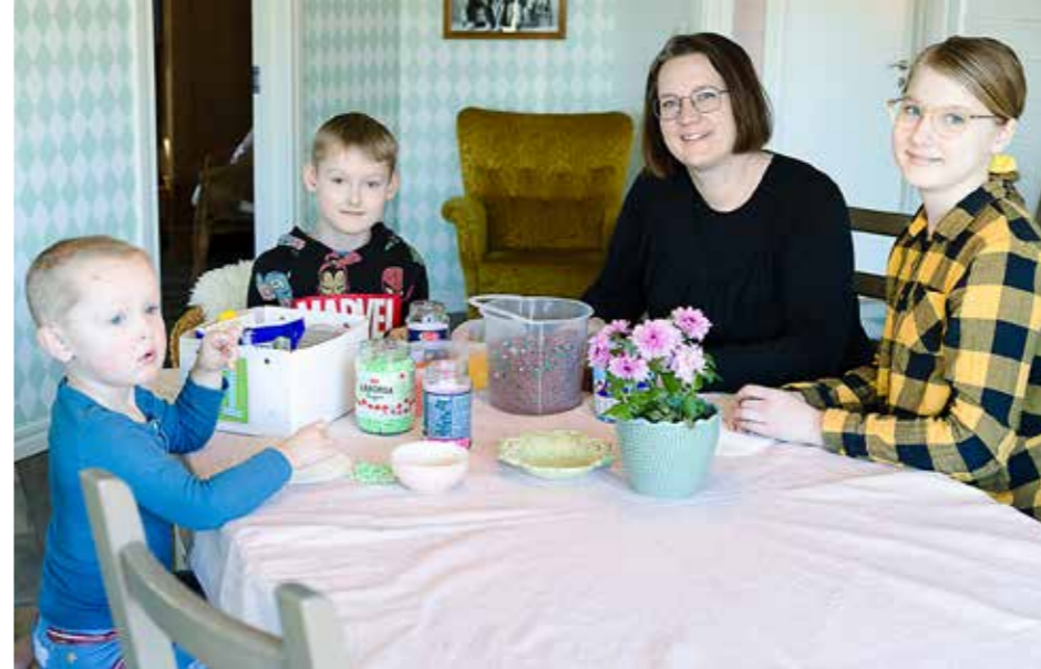
KREATIVA STUNDER. I vardagsrummet finns också ett stort bord som är perfekt att samlas vid när det är dags att koppla av med lite pyssel med pärlor.

- Nästa projekt tror jag kan bli köket. Men jag är lite kluven. Det ligger i den gamla delen av huset och har sin charm men är kanske inte så praktiskt längre. Vi får se