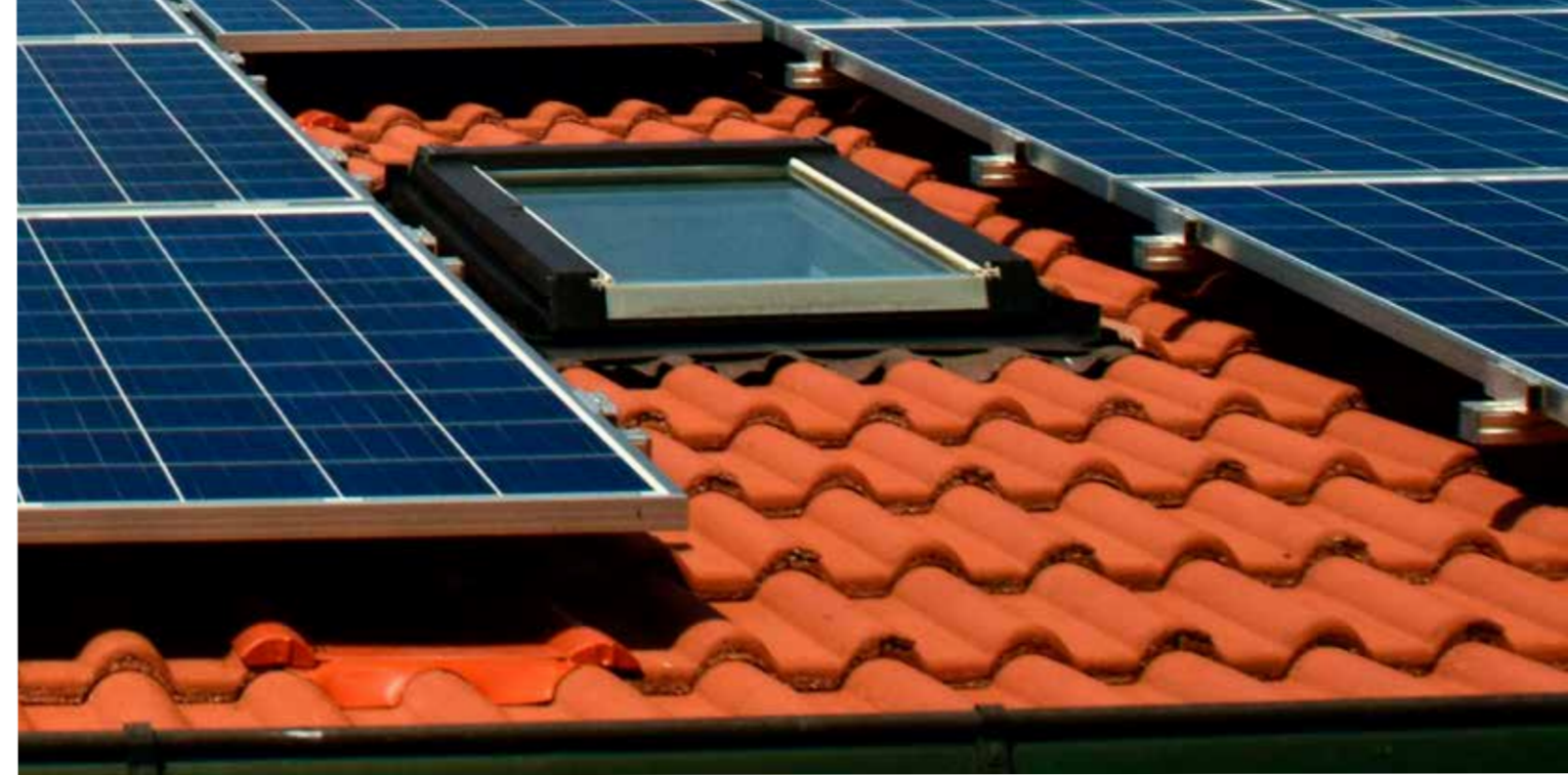
SOLEL. Det blir allt vanligare att installera solceller på taket bland husägare.