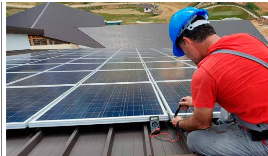
SÄLJ EL. När din egen elproduktion är större än din förbrukning kan du sälja överskottet till ditt elbolag.

ren är utbytt, är du redo att påbörja din produktion av fossilfri och förnybar solet. Du kan enkelt följa din soletsproduktion via en app. Och när din egen elproduktion är större än din förbrukning kan du sälja överskottet till ditt elbolag.