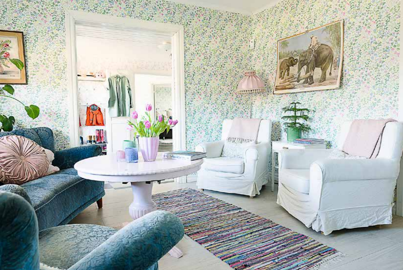
POPULÄRT RUM. I gången mellan de båda huskropparna har familjen inrett ett sällskapsrum utan TV. Här myser man med böcker framför den öppna spisen.

F em år tidigare hade de valt bort huset för ett annat. De hade bosatt sig i Broby med sina då två barn. Där hade de gått all in med omfattande renovering och trivdes gott. Men allt eftersom familjen blev större kom också behovet av större utrymme. Då lyftes blicken mot något annat. Ett hus byggt på 30-talet med en ovanligt stor utbyggnad.