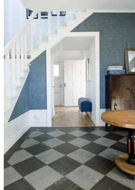
GENERÖST VÄLKOMNANDE. Entrén är stor och omfattande där golvet är den stabila basen och den vackra trappan står för ljuva stråkar.