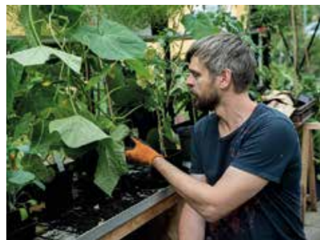
TIPS. Börja med att använda den jord som finns där du tänker odla. Med ogrärensning, näring och organiskt material kan det bli en bra odlingsjord.