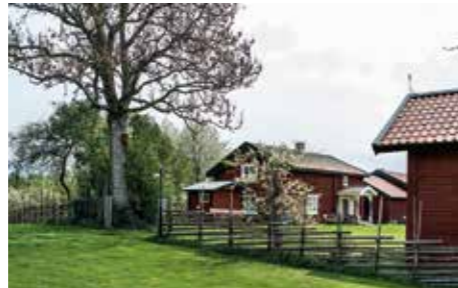
LÅNGGÅRDESGÅRD. Den vanligaste gårdesgårdsformen i Sverige. Den kan göras med en eller flera slanor mellan vidjorna, och med olika höjd på störrarna.

– Det är så jag har lärt mig och det blir både snyggt, tätt och hållbart. Det är också det som är det absolut vanligaste. Av de gårdesgårdar som byggs idag är nog 99 av