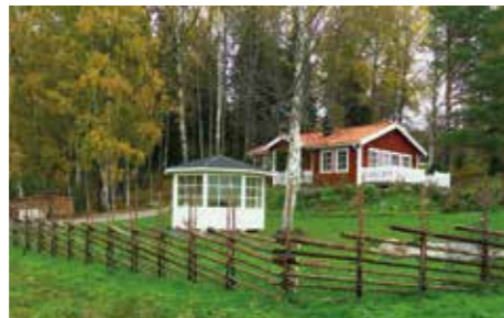
TRÄDGÅRDSMODELL. Gles långgårdesgård byggd av enkla slanor. Denna modell passar bra i slät terräng och är vanligt förekommande på villatomter.