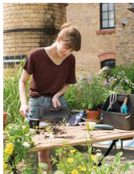
COMPACT. Tätbebyggd odling blir enklare med redskap med multifunktion.