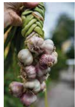
SJÄLVFÖRSÖRJANDE. – Bästa vitlökskördan får vi i Tillsammansodlingen.