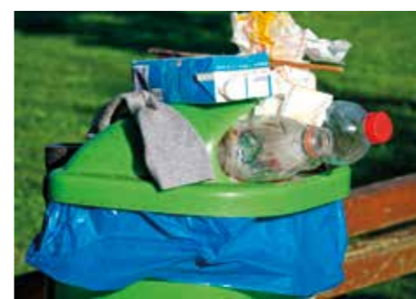
FÖRENKLA. Gör systemet för avfallshantering logiskt, så ska ni få se att vi villaägare kan sopsortera, uppmanar Villaägarna.