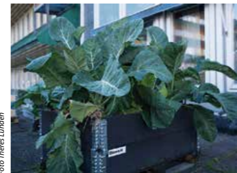
PÅ TAKET. Takterrassen är ett spännande stadsodlingsprojekt. – Förutsättningarna för odling här blir andra. Klimatet i detta skyddade läge är varmare.