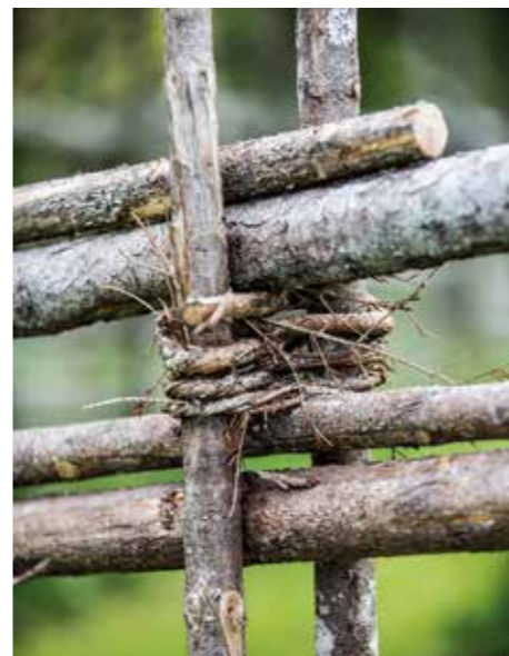
FÄRSKA GRANKVISTAR. Enligt gammal tradition binder man sin gårdesgård med vidjor. För att få dem hanterliga kan man ånga dem eller värma dem några minuter i varmt vatten.

– Jag tror att anledningen till att de flesta vill ha hjälp med jobbet är att det inte är särskilt mycket dyrare. Det handlar bara om en hundralapp mer per löpmeter. Och så är det förstås rätt tungt för kroppen att bygga. Men svårt är det som sagt inte. Av de kunder som köpt gör-det-självpaketet genom åren är det bara en enda som hört av sig för att få hjälp, och det var för att han hade skadat sig i handen.