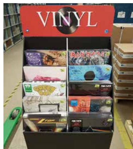
COMEBACK. T ex David Bowie, Led Zeppelin, Håkan Hellström och Ed Sheeran.

nation av både vore såklart idealt. Sedan ska vi inte glömma vädret som 20 % av de svarande håller som viktigast för att grillkvällen eller grillfesten ska bli en succé.