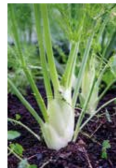
VARMT KLIMAT. – Chili, tomat och fänkål trivs extra bra på takfarmen.