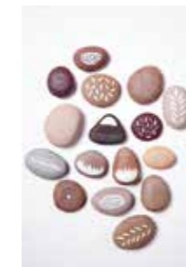
LÄNGTAN. Håll en len sten i ena handen och en pensel i den andra. Kan du avhålla dig från att låta dem mötas?