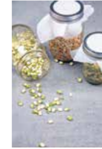
GRODDBARA EXEMPEL. Gula ärtor, röda, gröna och svarta linser, alfalfa, helt bovete, mungbönor och quinoa.