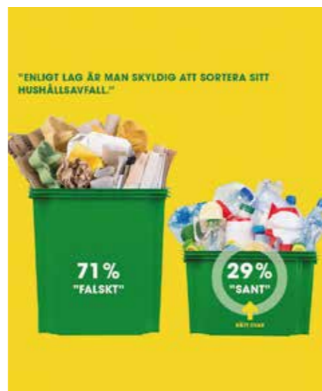
JA. Endast 3 av 10 svenskar vet att man enligt lag måste sopsortera.