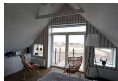
FRI SIKT. Utsikten från sovrummet är minst sagt magnifik. Glasricken på balkongen utanför maxar luftigheten.