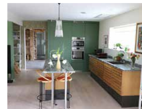
MED VÄRME. Köket toppmodernt inrett med ombonat känsla. Bänkskivorna i granit är från Dala Sten.

■ Bostadsytan är 172 kvadratmeter och dessutom finns 50 kvadratmeter till som komplementyta.