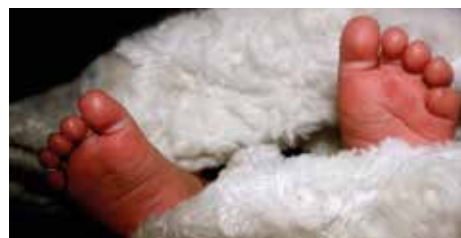
INSPEKTION. Projektet fokuserar på textilier som är vanliga i barns hem.