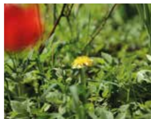
I NATUREN. Nu börjar säsongen för det matnyttiga som ibland kallas ogräs.

NÄSSLAN. Torkas upp och ner. Går att mixa till pulver för smoothies. God krydda. Används också färska i soppa och gratänger. Undvik att plocka dem på kväverika platser som vid lantbruk och komposthögar.