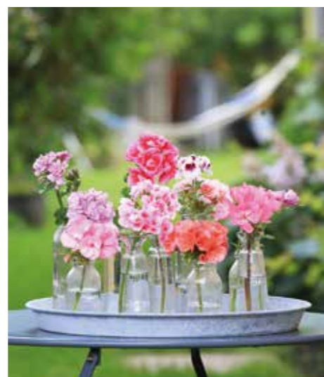
FINASTE. Bordsdekorationen är inte längre bort än dina pelargonkrukor.

■ Äntligen dags för sommarkänslornas blomma. Passa på att hitta nya sätt att göra fint med pelargoner. För här finns mycket dekoration att skapa. Pelargoner är rikblommade vilket gör att det fungerar bra att knipsa av blommor för att använda som snitt. En bukett pelargoner passar lika bra inne på köksbordet som ute i trädgården. Som enkla solitärer i vaser blir de också dekorativa. Särskilt om du ställer flera vaser med en blomma i vardera tillsammans på en bricka. Det är också fint att plocka en stickling och ställa i en glasflaska. Den får dekorativa rötter som bonus till de härliga bladen.