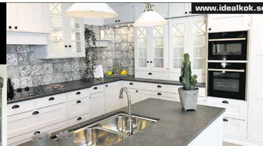
tibrokok | idealkök | EUNOSÄTER KÖK | Exklusivt