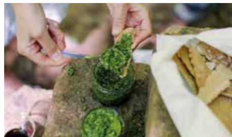
VILD RÅVARA. Ramslök trivs i skuggiga lövskogar i södra Sverige och är inte så enkel att hitta. Men när du väl hittat ditt ställe är smaken värd besväret. Smaksättare t ex i soppa, pesto, örtsalt.

– Jag struntar i att odla spenat och använder kirskaål i smoothies, grytor, soppor, gratänger och allt annat där bladgrönt används. Ramslök är nu trend och finns att köpa