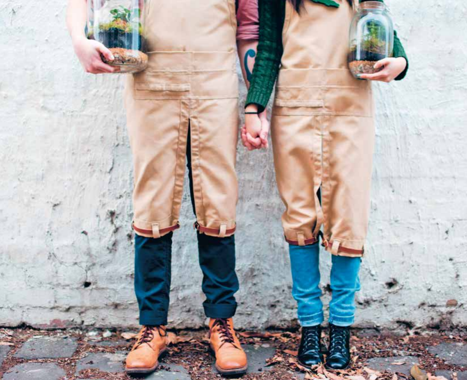
KOPPLA AV. Det går att få in närhet till naturen i din vardag. Så att kreativiteten får sitt samtidigt som din värld börjar snurra aningen långsammare.