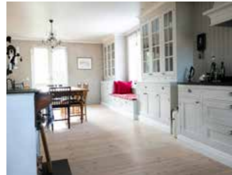
GENERÖST KÖK. En vägg revs för att öppna upp för större ytor och ett ljusinsläpp dagen lång.