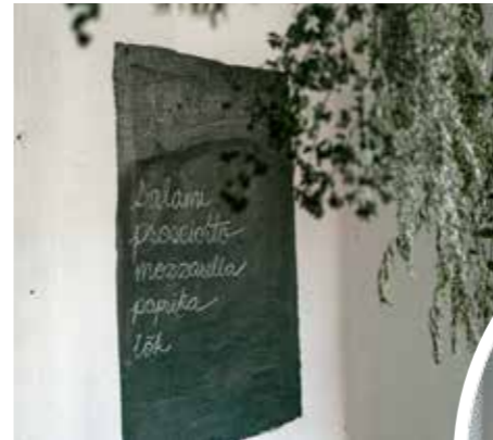
MENY. På en svart stenplatta kan gästerna se vad som serveras för dagen i familjens egen pizzeria.

en tid var huset byns handelsbod. Den lades ner 1964 och huset blev då permanent bostad. Många har haft sitt första boende i tingshuset, som hyresgäster för det fanns ju gott om plats med 3 lägenheter.