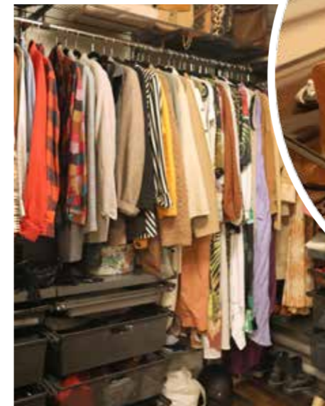
LAGER- PÅLAGER-KOMPISAR. Cecilia placerar kläderna på klädstängen efter det som funkar ihop.

Hennes garderob består mest av basplagg men även en kul uppsättning