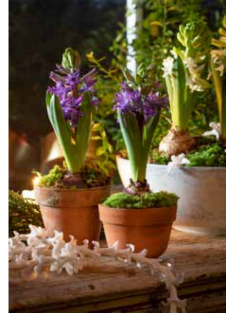
LÖKVÄXTER. De vackra lökarna är en del av upplevelsen.