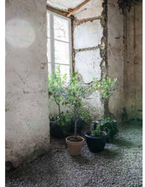
VINTERFÖRVARING. I denna del av huset fanns förr bland annat vishusboden. Här får olivträden bo under vintern under tiden som familjen renoverar klart. Åtskilliga timmar av grävning och gruslass har gått åt för att lägga grunden till ett nytt golv.