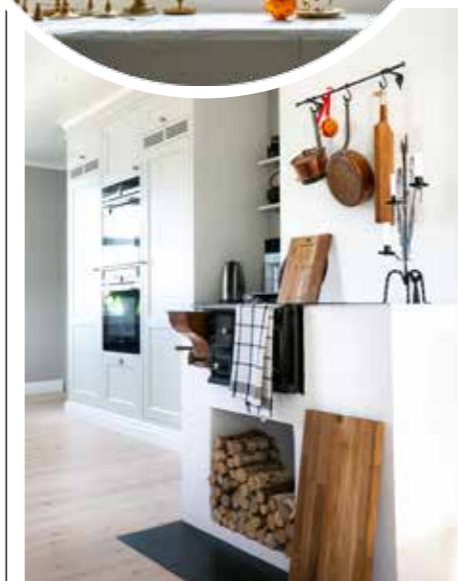
TILLVARATAGET. Den gamla järnspisen fanns redan i köket men på annan plats. Nu står den centralt och värmer under kyliga dagar.

nya recept provas både i deg och till fyllning, tillsammans med goda vänner. Och på tal om goda vänner.