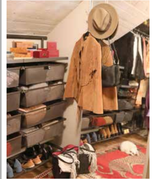
MAXAD YTA. Utrymmet är väl utnyttjat för maximal förvaring och dörren till förrådet togs bort till förmån för en skjutdörr.

– Jag letar upp unika saker som ingen annan vill ha.