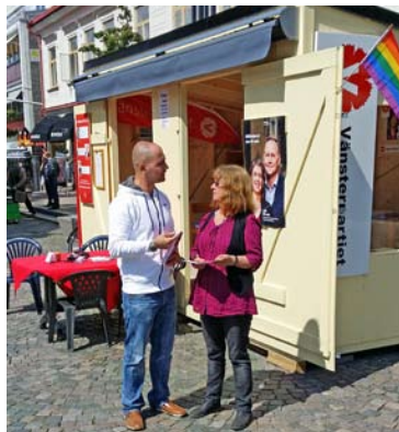
V-boa, Vänsterpartiets valstuga Storgatan, Växjö