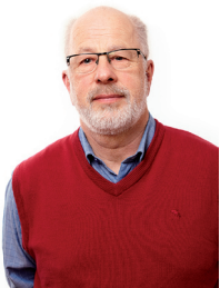
Vice ordförande i Överförmyndarnämnden, ÖN