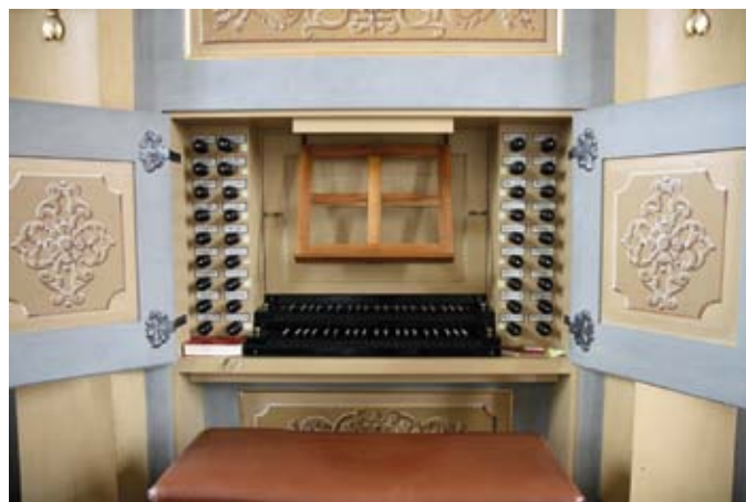
Spelbordet i Freiberg Petrikerche