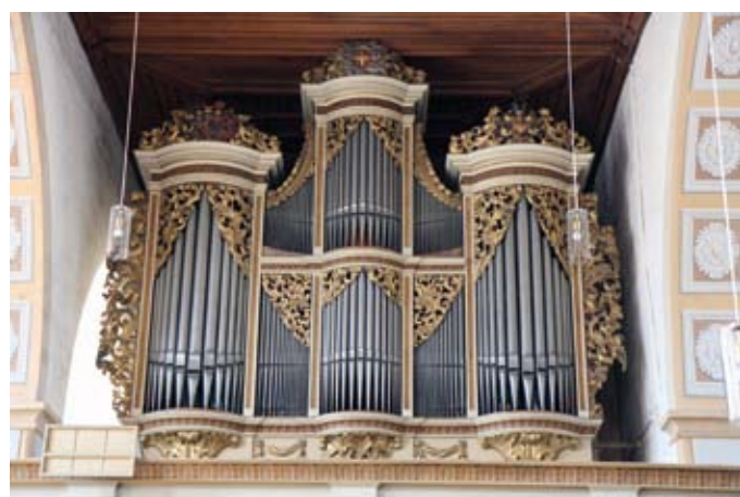
Silbermannorgeln i St Georgskyrkan, Rötha