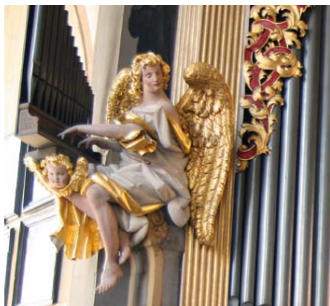
Fasaddekorativ fjärde manual i Freiburger Dom.