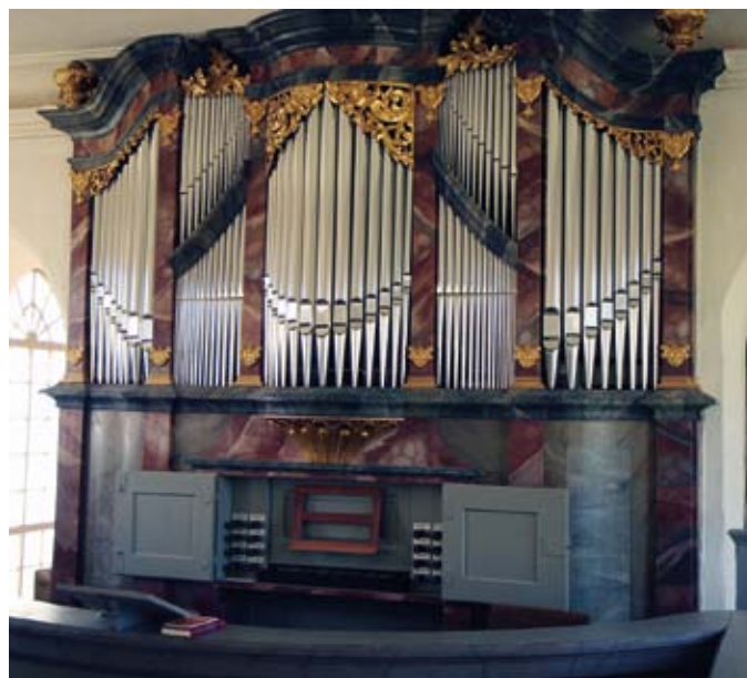
Hildebrandtorgeln i Störmthal

Efter Rötha och Störmthal skulle vi egentligen ha besökt Nicolaikyrkan i den lilla byn Zschortau och lyssnat till orgeln från mitten av 1740-talet byggd av Johann Scheibe, men