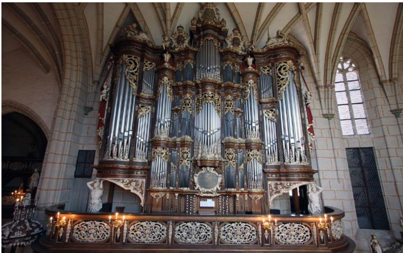
Den praktfulla Trostorgeln i slottskyrkan, Residenzschloss, Altenburg

Den fjärde orgeldagen inleddes med bussfärd till den lilla byn Pomben sydost om Leipzig. Här hittar man i den lilla Wehrkirche Sachsens äldsta spelbara orgel. Ett litet enmanualligt instrument med fyra pedalstämmor och nio stämmor i manualen, som restaurerats av orgelbyggaren Kristian Wegscheider från Dresden 2007. Pedalen hade s.k. kort oktav, som alltså saknade halvtoner i den lägsta oktaven. Orgeln byggdes ursprungligen av den relativt okände Gottfried Richter 1671, men har under seklernas gång byggts om ett antal gånger, för att nu återställts i sitt ursprungliga skick av Wegscheider. I bl.a. några satser ur Samuel Scheidts Par-