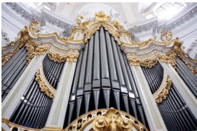
Den mäktiga orgeln i Hofkirche, Dresden (se även omslag till OF 4-2010)

På kvällen återkomna till Dresden kunde några av oss beundra den återuppbyggda Semperoperan, där vi fick uppleva en föreställning av Bizets Carmen. Man kunde inte annat än imponeras av den detaljrika rekonstruktionen av alla arkitektoniska utsmyckningar inklusive statyer och väggtavlor i det som för bara några år sedan var ett tomt urblåst skal, med endast de sotiga ytterväggarna bevarade sedan andra världskriget.