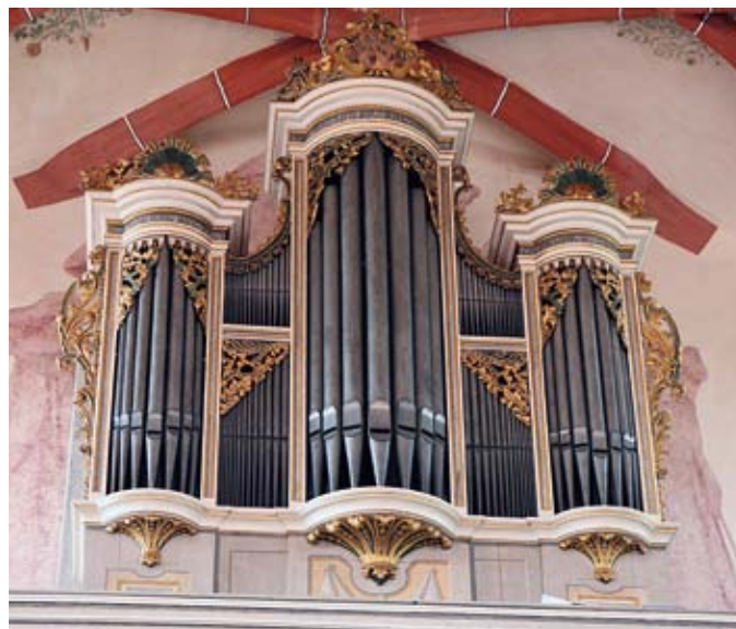
Silbermannorgeln i Marienkirche, Rötha