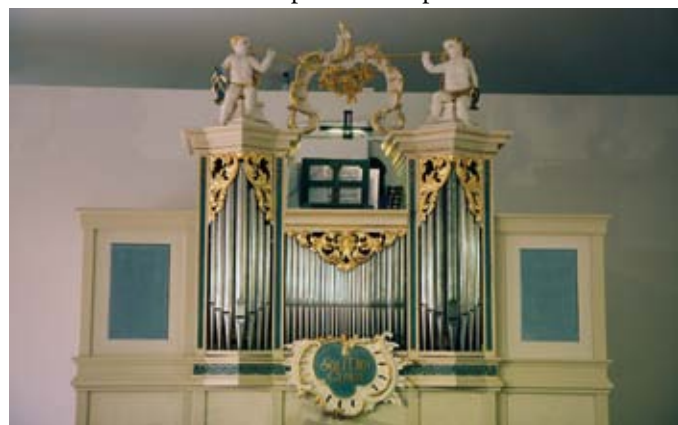
Silbermannorgeln i Grassimuseet, Leipzig