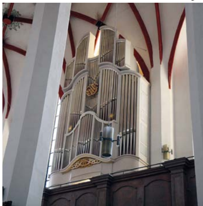
Den s.k. Bachorgeln byggd av Woehl på sidoläktaren i Thomaskyrkan, Leipzig