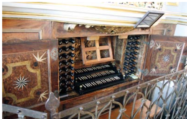
Spelbordet till den stora Silbermannorgeln i Freibergs domkyrka