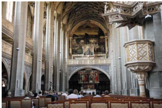
Marktkirche, Halle med korgorgeln ovanför altaret