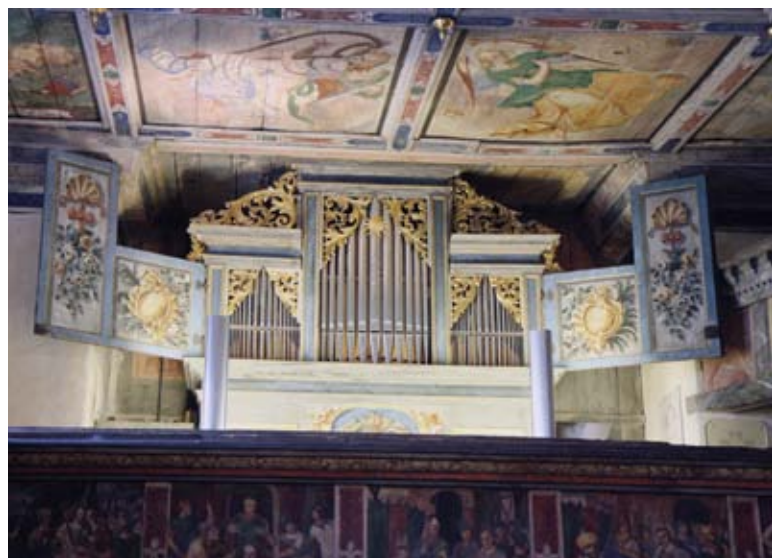
I den oerhört dekorerade gamla Peter-Paulskyrkan i Coswig finner man detta instrument

Efter den minnesvärda demonstrationen av Hofkirches orgel satte vi oss i bussen för transport till den nya centralstationen i Berlin, där vi skulle ta nattåget till Malmö. Men vi gjorde två uppehåll på vägen för att titta på två intressanta