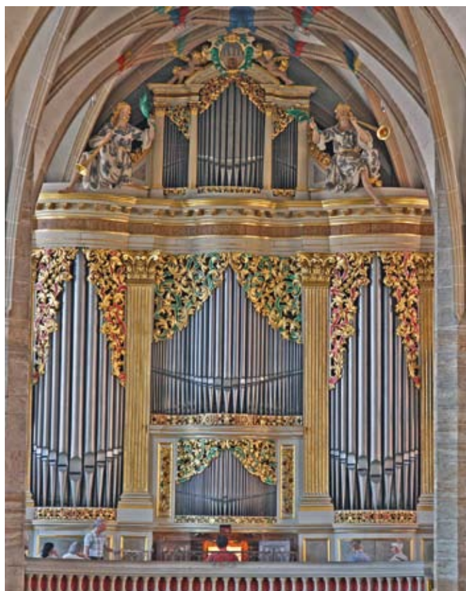
Silbermannorgeln i Freiberg Dom

Tidigt på midsommardagens morgon startade Orgelsällskapets orgelresa i år. I denna arla morgonstund hade deltagarna i årets orgelexkursion samlats på perrongen på Köpenhamns centralstation. Redan 7.44 bar det iväg med tåget mot Hamburg för vidare befordran till Leipzig via Berlin. Syftet med årets orgelresa var att på ort och ställe se, höra och studera några av de mest berömda barockorglarna i Sachsen och Sachsen-Anhalt i östra Tyskland. Flera av orglarna som vi skulle stöta på var instrument som självaste fader Bach spelat på. Och många av instrumenten var byggda av en av de berömda orgelbyggarbröderna Silbermann. Gottfried Silbermann, född i Sachsen 1683, lärde sig orgelbyggeri hos sin bror Andreas i Strassburg i Elsass, i dåvarande Sydtykland. 1710 flyttade Gottfried tillbaka till Sachsen där han öppnade en egen orgelverkstad i Freiberg. Några år senare hade han byggt sitt första större instrument, den 44-stämmiga, tremanualiga orgeln i Freibergs domkyrka. Ett instrument som vi skulle få lyssna till under vår orgelresa. Men vår första anhalt var Leipzig, där vi redan första kvällen fick lyssna till den stora orgeln i Nikolaikyrkan.