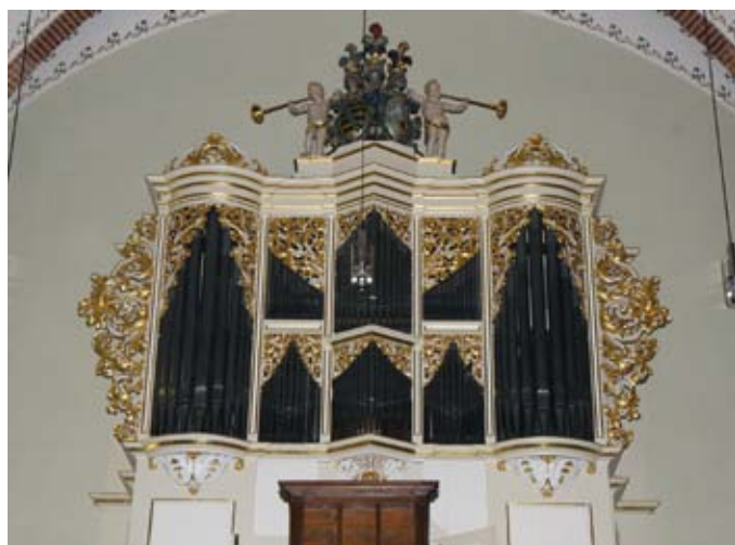
Silbermannorgeln i Freiberg Jakobikirche

På www.orgelsallskapet.se finns ett stort antal länkar till information om de olika orglarna, historik och disposition.