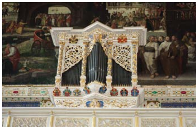
Den vackra kororgeln i Marktkirche, Halle byggd 1664